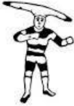
KOTAIX O HALAHACHES